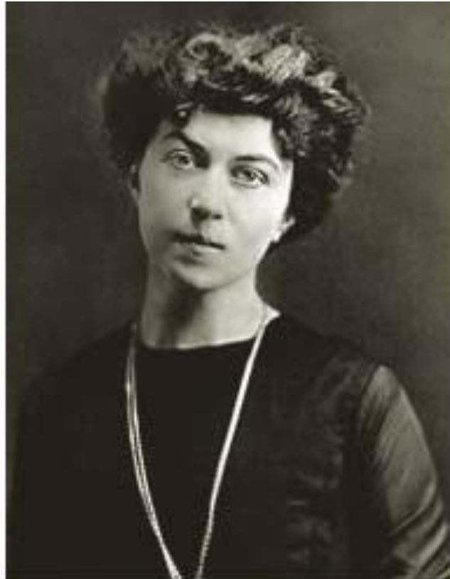
Aos 30 anos