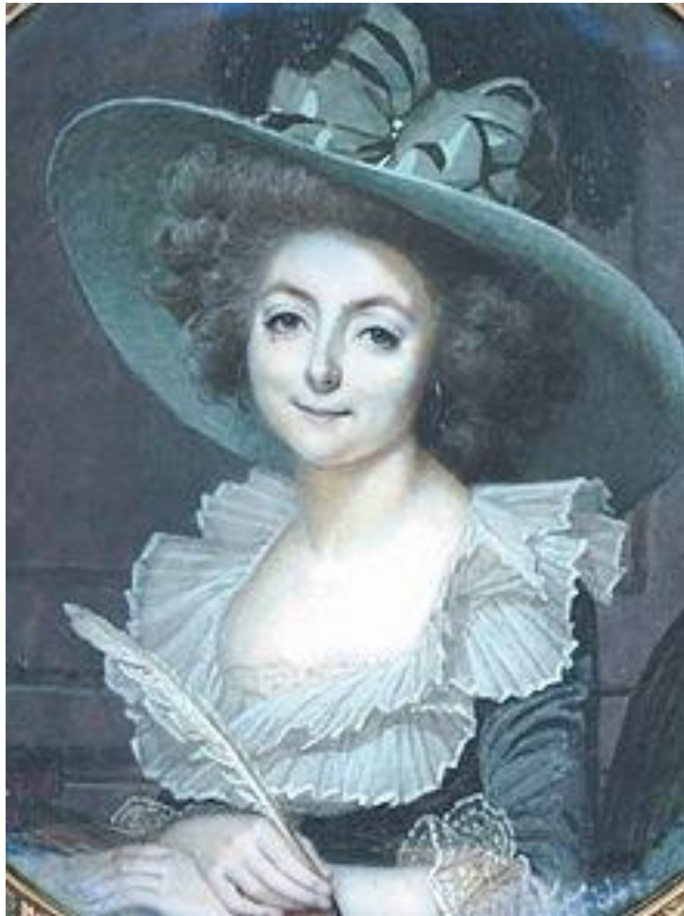
Sophie de Condorcet