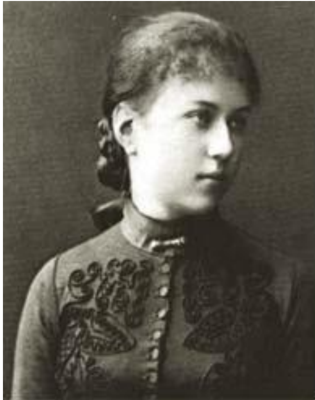
Alexandra Kollontai aos 16 anos