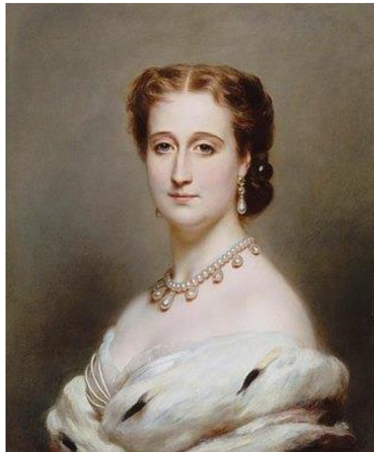
L'impératrice Eugénie épouse de Napoléon III